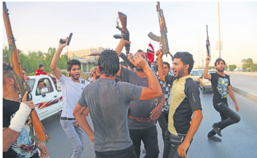
Junge Fanatiker der momentan bekanntesten Terrororganisation «Islamischer Staat», die in Syrien und im Irak aktiv ist. Sie rekrutiert ihre Soldaten zu Tausenden aus dem Ausland - sind auch Kämpfer aus Liechtenstein darunter?

Die öffentliche Angst vor Terror geht momentan aber vor allem von den radikalen Auswüchsen des Islam aus: So macht der Islamische Staat (IS) mit medienwirksamen Enthauptungen oder die Terrorgruppe Boko Haram mit Mädchenentführungen auf sich aufmerksam. Solche Organisationen haben, dem guten Menschenverstand zum Trotz, regen Zulauf aus dem Ausland - Tausende schliessen sich dem «heiligen Krieg» in Syrien und im Irak an. Dieses zu unterbinden, hat sich die UNO vor Kurzem in einer Resolution gegen Terror-Tourismus auf die Fahnen geschrieben; die Umsetzung führt bereits zu grossen Debatten um den Konflikt mit den Grundrechten der