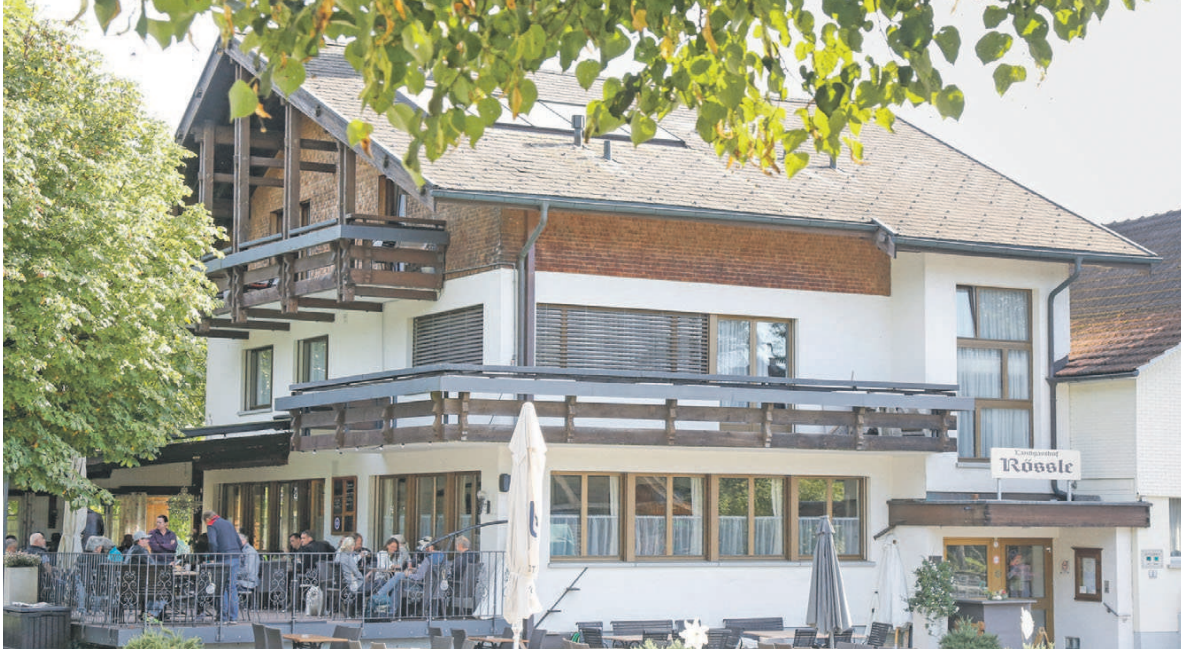
Der Traditionsbetrieb Landgasthof Rössle in Ruggell ist seit Ende November wieder geöffnet.