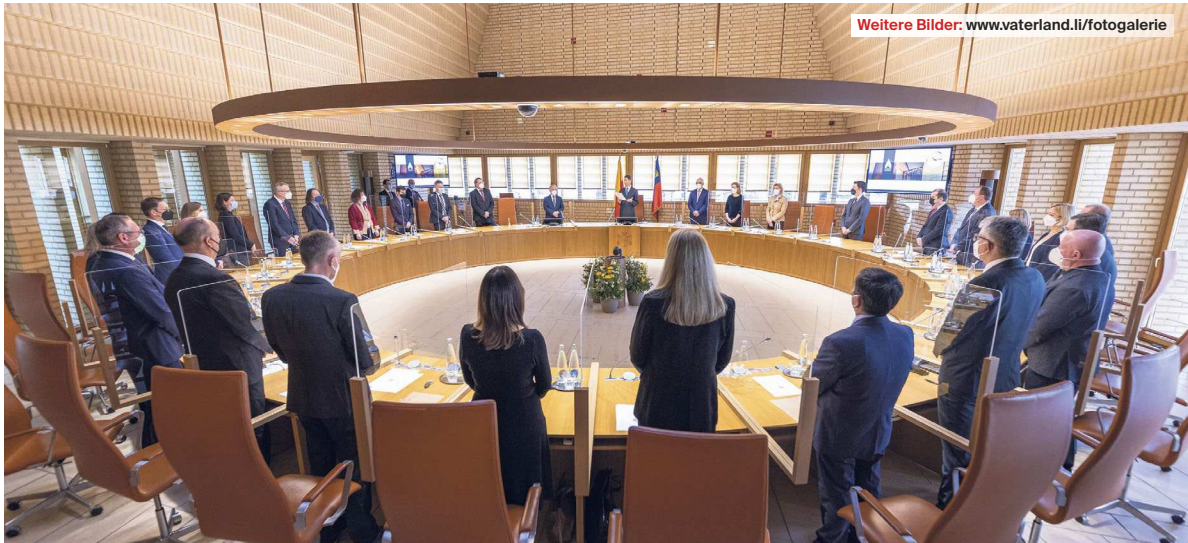
Für den Landtag beginnt nun offiziell das zweite Jahr der Legislatur – gestern wurde er feierlich eröffnet.