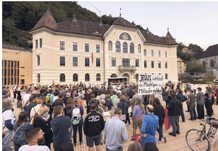
Im Rahmen der Coronademonstrationen in Vaduz kam es unter anderem zu verbalen Entgleisungen – auch Plakate mit problematischen Inhalten wurden gezeigt. Bild: Daniel Schwendener (17.9.21)

Seit mehreren Jahren sind in Liechtenstein keine grösseren Gewaltvorfälle mit extremistischem Hintergrund zu verzeichnen. Aufgrund der Covid-19-Pandemie war das Jahr 2021 allerdings auch durch eine zunehmende Zahl an Veranstaltungen gegen die Massnahmen zur Bekämpfung der Pandemie gekennzeichnet. «An diesen Kundgebungen wurden teilweise Reden und Plakate mit problematischen Inhalten gehalten und gezeigt. Dabei kam es auch zu verbalen Entgleisungen (Holocaust-Verharmlosungen, Beleidigungen) einzelner Personen bzw. Gruppen, was zu Anzeigen führte», wird im Monitoringbericht festgehalten. Zudem sei festzustellen gewesen, dass sich in Teilen der massnahmenkritischen Bewegung in Liechtenstein ähnliche Tendenzen wie in radikalisierten Szenen anderer europäischer Länder verfestigt hätten. Dabei seien die staatlichen Covid-19-Massnahmen als fundamentale Bedrohung der verfassungsmässigen Freiheitsrechte