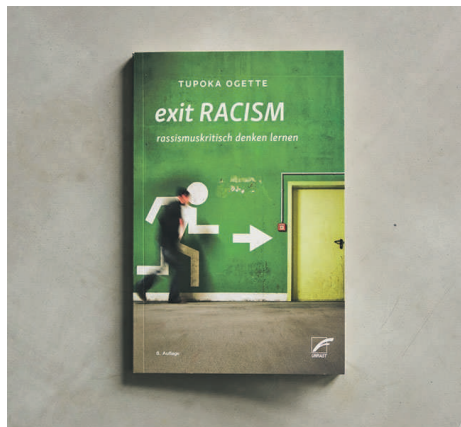
Buch «Exit Racism».