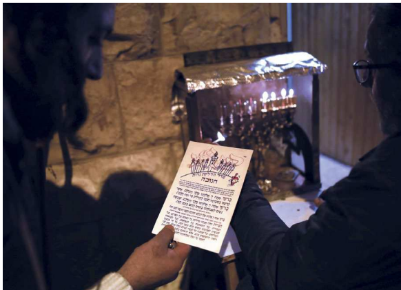
Chanukka oder Lichterfest ist ein jährliches Fest, das acht Tage lang dauert.

Besonders die Verfolgung der Juden durch Nazi-Deutschland ab 1933 führte zu diesen Einwanderungen. Insgesamt fanden in der Zeit des Zweiten Weltkriegs rund 230 jüdische Flüchtlinge vorübergehend Schutz in Liechtenstein. Bis zum Kriegsende 1945 lebten durchgehend etwa 120 ausländische jüdische Personen in Liechtenstein, was ungefähr ein Prozent der Wohnbevölkerung entsprach. Mit dem «jüdischen Hilfskomitee für Liechtenstein» half man ab Herbst 1940 allen ausländischen Juden in Liechtenstein durch Beiträge. Kurz nach Kriegsende emigrierte die Mehrzahl der Ju-