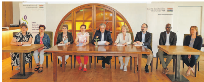
Der Vorstand des VMR blickte an der gestrigen Jahresversammlung auf ein ereignisreiches Jahr zurück.

Ausserdem steht in Sachen Inklusion und Gleichstellung von Menschen mit Behinderung ein Paradigmenwechsel an, wie Längle betont. Und zwar mit der UNO-Behindertenrechtskonvention. «Sie legt den Fokus nicht mehr auf die Bedürftigkeit von Menschen mit Behinderung, sondern auf ihre Rechte», so die Geschäftsstellenleiterin. Dabei werden vor allem die Inklusion sowie die Barrierefreiheit gefördert. Und zwar Barrierefreiheit in allen Belangen: «Man meint oft, Barrierefreiheit sei reine Rollstuhlgängigkeit. Das ist aber nicht alles. Es bedeutet auch, Informationen für alle Menschen zugänglich zu machen.» Alle Strukturen, Gesetze und Abläufe sollen demnach so ausgestaltet sein, dass Men-