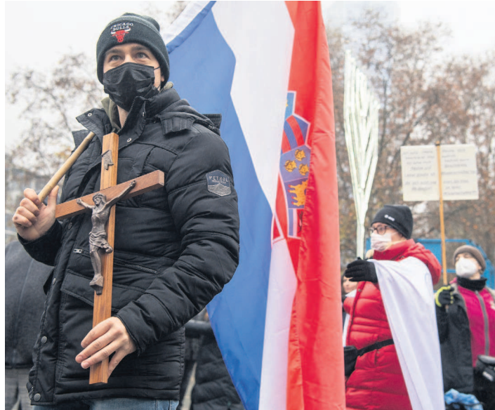
Die Coronapandemie bescherte der Reichsbürger-Bewegung einen enormen Mitgliederzuwachs aus der Querdenker-Szene.

«Corona erwies sich für den GCCL als Glücksfall: Die Bewegung erlebte ein gewaltiges Wachstum.»