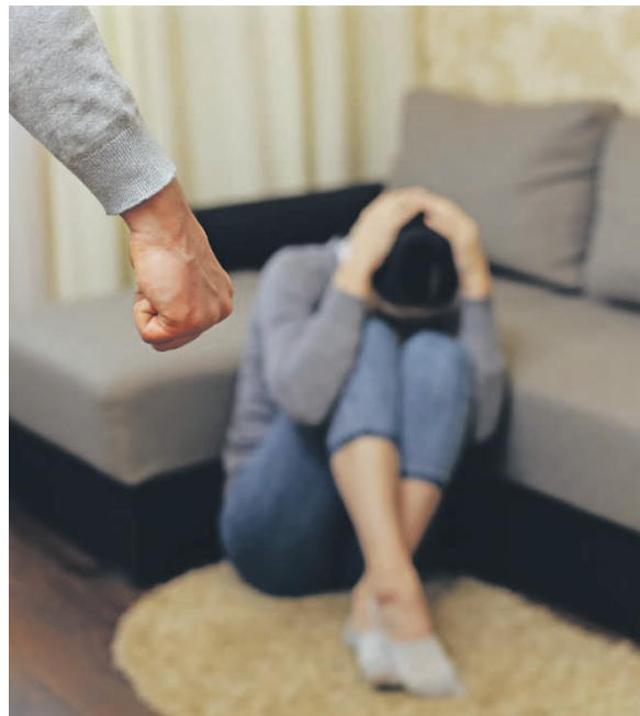
Dank Gesprächen und Vermittlungen von weiteren Anlaufstellen konnte die Landespolizei viele Konflikte entschärfen.