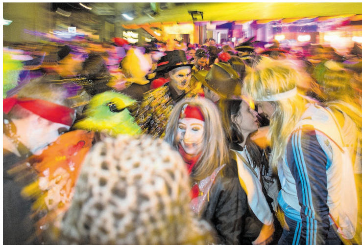
Eine originelle Verkleidung wäre keine Hexerei. Fasnachtstreiben am Schmoos 2019 in Luzern.