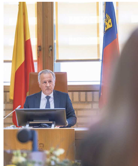
Landtagspräsident Albert Frick

Einmal mehr betonte er die Notwendigkeit, sich auf einen langfristigen, strategischen Orientierungsrahmen zur erfolgreichen Bewältigung der demografischen Entwicklung zu einigen. Die Arbeit daran dürfe jedoch nicht zu einer Verzögerung von nötigen Reformmassnahmen führen – im Gegenteil. Nötige Massnahmen sollten sofort umgesetzt werden. Diesbezüglich gab der Erbprinz der Politik auch einige konkrete Gedanken mit, in welche Richtung die Vision, die Zielsetzungen und die Prinzipien zur erfolgreichen Bewältigung der demografischen Entwicklung gehen könnten. «Liechtenstein sollte die Vision haben, ein Land von hoher Lebensqualität zu sein, in dem Menschen gut und gerne älter werden. Bis ins hohe Alter sollten die Einwohnerinnen und Einwohner am gesellschaftlichen Leben aktiv teilnehmen sowie möglichst unabhängig und selbstbestimmt leben können», wünscht sich Erbprinz Alois. Generationen sollten sich