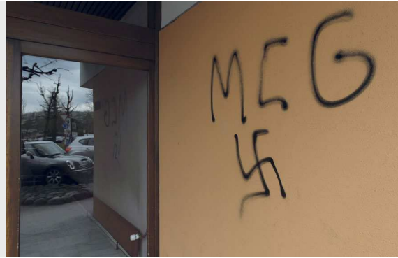
In der Schweiz wurden nach den Protesten wieder Stimmen zum Nazi-Symbolverbot laut.

Die Abklärung des Bundesamtes für Justiz hat ergeben, dass die öffentliche Zurschaustellung von Nazi-Symbolen in der