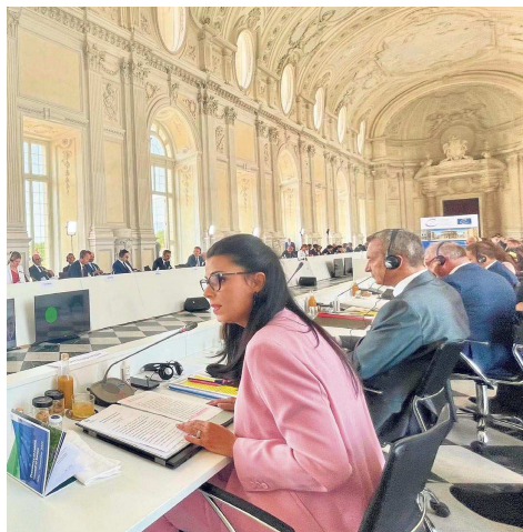
Aussenministerin Dominique Hasler betonte bei ihrer Rede die Bedeutung des Europarats.

Regierungsrätin Dominique Hasler brachte in ihrer Rede die Solidarität Liechtensteins mit der ukrainischen Bevölkerung zum Ausdruck und verurteilte die Aggression Russlands erneut aufs Schärfste. Sie betonte die Bedeutung des Europarats, gerade in Zeiten wie diesen, in denen Demokratie und Rechtsstaatlichkeit verstärkt bedroht sind und Menschenrechte teils erheblich verletzt werden. «Die Werte des Europarats sind unsere Werte. In unserer aussenpolitischen Arbeit setzen wir uns daher tagtäglich für den Schutz dieser grundlegenden Werte ein», so Regierungsrätin Hasler. Sie versicherte, dass Liechtenstein dem anstehenden liechtensteinischen Vorsitz im Ministerkomitee höchste Priorität beimessen wird. Mit der im Oktober 2021 erfolgten Ratifikation der Istanbul-Konvention hat Liechtenstein bereits ein starkes Zeichen gegen Gewalt gegen Frauen und gegen häusliche Gewalt gesetzt. Das Engagement für Frauenrechte ist seit Jahren wichtiger Bestandteil der liechtensteinischen Aussenpoli-